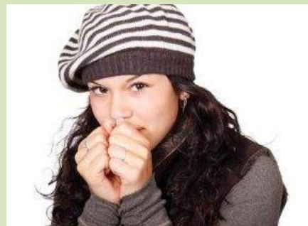
Mie hâ brâ kê